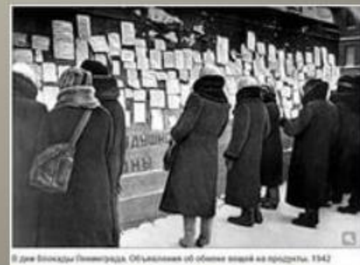
В дни блокады Ленинграда. Объявление об обмене вещей на продукты. 1942